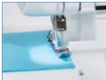
Piano di lavoro illuminato con luce a LED