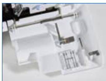
Vano accessori incorporato