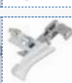
Piedino per perle e lustrini

Per attaccare perle e lustrini ai tessuti.