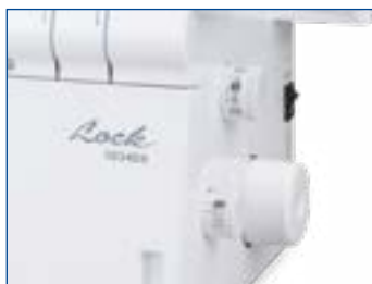
Facile accesso alle manopole di regolazione