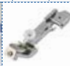
Piedino per nastri e tessuti elastici

Per attaccare nastri ed elastici a tessuti stretch.