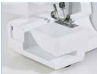
Piano di cucitura modificabile in base piana e a braccio libero